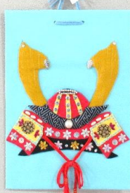
作 進藤 はなえ様