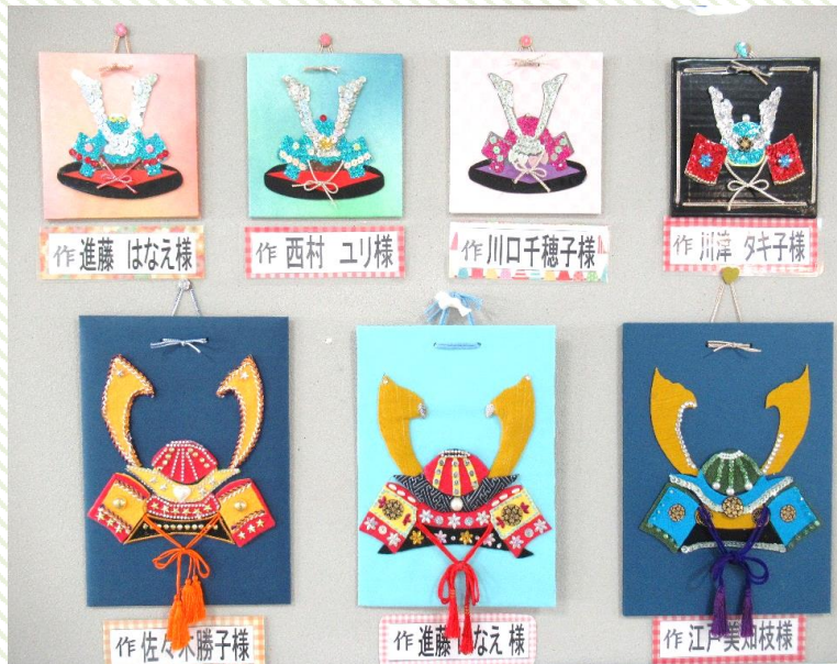
作 進藤 はなえ様