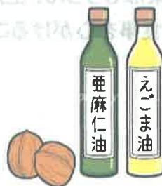
えごま油 亜麻仁油 菜種油 くるみ

※ただし酸化しやすいので、加熱しないでサラダなどの ドレッシングなどに利用するとよいでしょう。